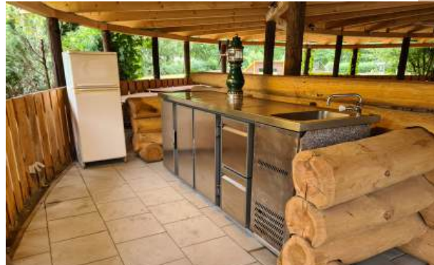
Große Rondell - Platz für 100 Personen mit Tresen zum Getränkekühlen